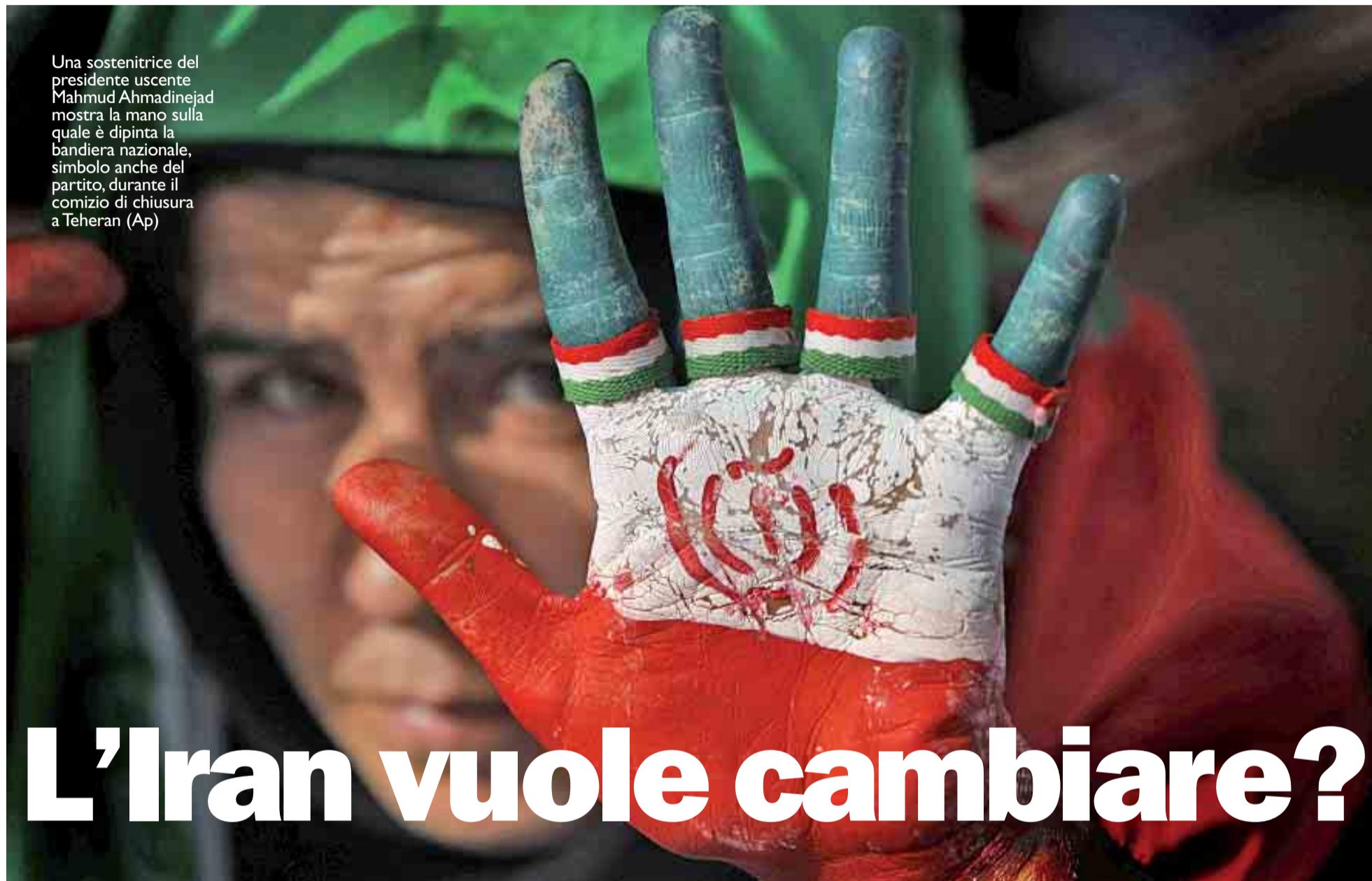
Una sostenitrice del presidente uscente Mahmud Ahmadinejad mostra la mano sulla quale è dipinta la bandiera nazionale, simbolo anche del partito, durante il comizio di chiusura a Teheran